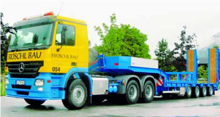
Eine von vielen Varianten: Für den alternativen Transport von Langgut verfügt der vierachsige Tieflade-Trailer von Empl über einen entsprechenden Auflagebock.