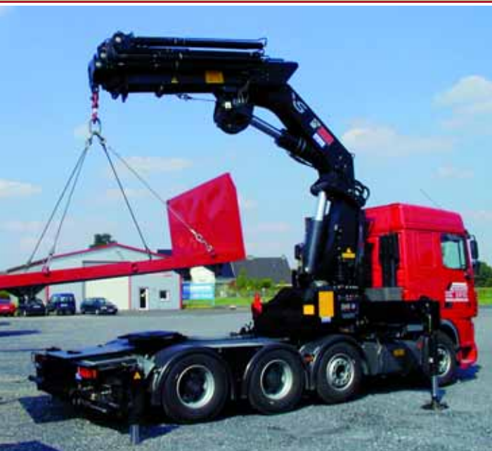
Ladekran im XXL-Format: Die Produktpalette von Hiab-Ladekränen reicht bis in die 100-mt-Klasse.

Unter dem Dach des deutschen Hiab-Stammsitzes, der von Thomas Koskimaa geleitet wird, befindet sich neben Vertrieb und Verwaltung eine Werkstatt, die teilweise auch für den Fahrzeugbau genutzt wird. Hier werden viele Produkte angeliefert, um sie an die Vorgaben des deutschen Marktes anzupassen. Zudem umfasst die Zentrale in Langenhagen ein Lager mit einem umfangreichen Sortiment an Ersatzteilen. Neben der Zentrale in Langenhagen unterhält Hiab fünf weitere Standorte in Deutschland, an denen neben den Produktlinien Hiab und Multilift auch der Vertrieb der Produkte von Loglift/Jonsered, Moffett und Zepro gesteuert wird. Auch nach 50 Jahren bleibt der Standort Deutschland für Hiab einer der Hauptgaranten für den weltweiten Erfolg.