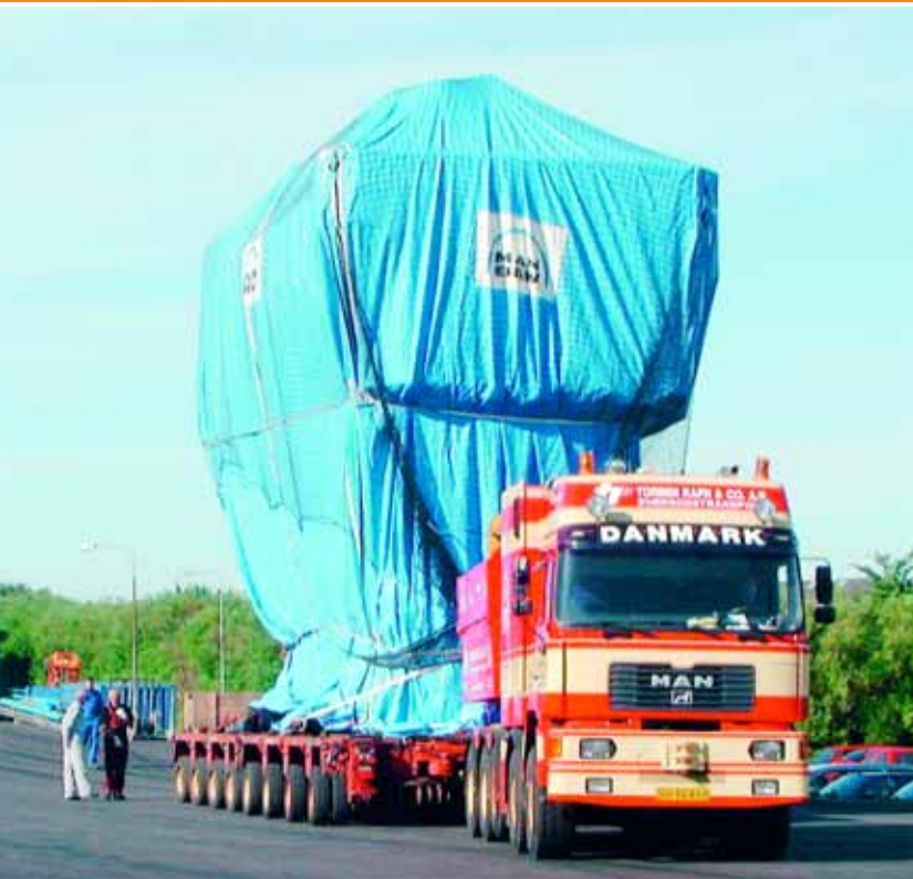
DÄNISCHE SPEZIALITÄT: Auch den besonders heiklen Transport ganzer Schiffsantriebe schultern die Achslinien von Goldhofer.