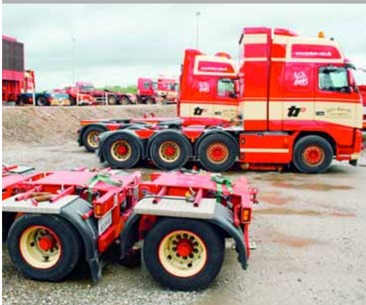
NOCH EINE SPEZIALITÄT: Um flexibel auf höhere Lasten zu reagieren, können die Zugmaschinen mit zusätzlichen Einzelachsen versehen werden.

ständigte man sich sehr schnell darauf, sich zukünftig auf Spezialtransporte zu konzentrieren.