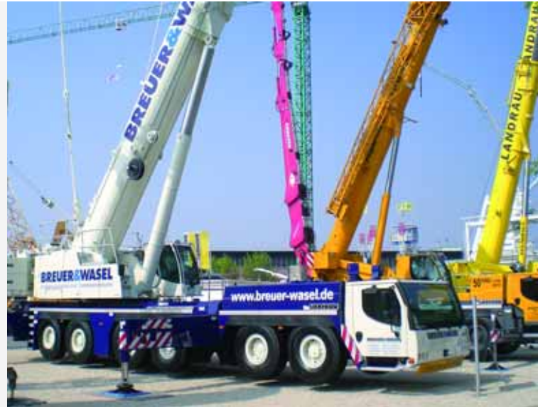
NEUHEIT BEI LIEBHERR: In Kundenfarben präsentierten die Ehinger auf ihrem gewohnt großzügig gestalteten Stand den neuen, sechsachsigen LTM 1350-6.1.