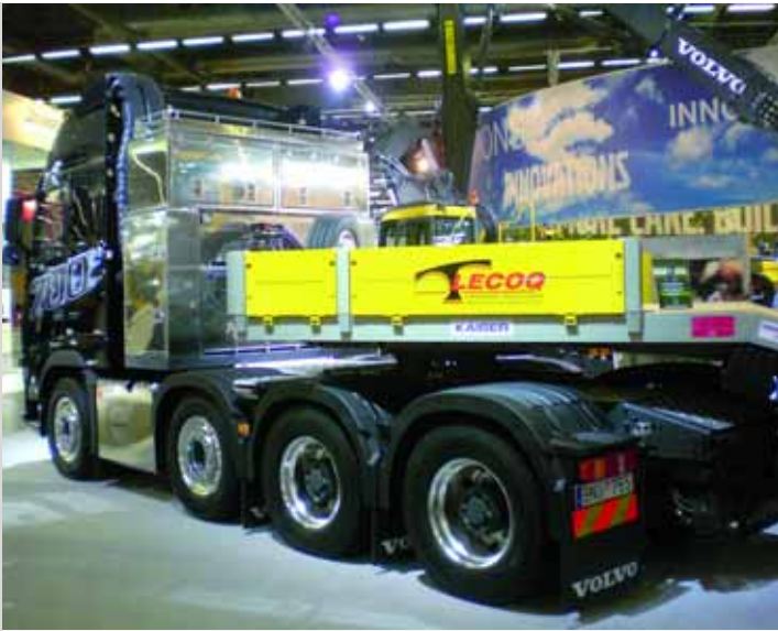
KONSEQUENTE ERGÄNZUNG: Angesichts der zahlreichen Baumaschinenexponate durfte auch das notwendige Schwerlastequipment nicht fehlen.