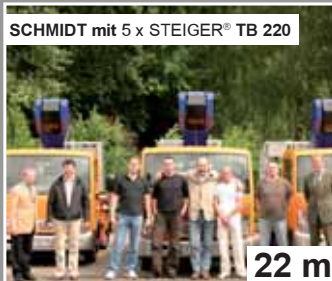
SCHMIDT mit 5 x STEIGER® TB 220