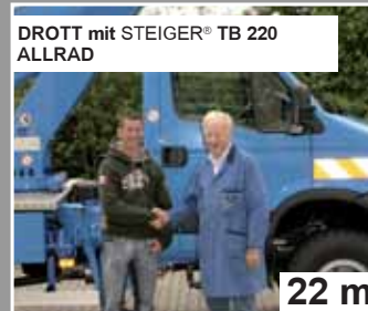
DROTT mit STEIGER® TB 220 ALLRAD