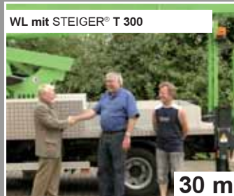
WL mit STEIGER® T 300