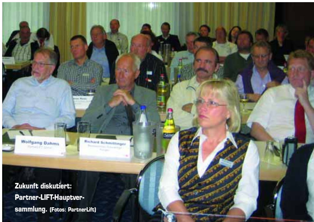
Zukunft diskutiert: Partner-LIFT-Hauptversammlung.