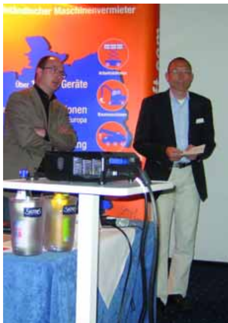
Fachlich: In separaten Beiträgen wurden Teilaspekte erläutert.