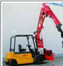
Lkw-Ladekrane von 1 bis 150 mto

zu Ladungssicherung. Abgerundet wird das KFA-Programm mit speziellem Fahrsicherheitstraining. Im Bereich Ladungssicherung handelt man darüber hinaus mit allen gängigen Ladungssicherungsmitteln, bietet eine Verladebegleitung an, gibt Verladeanweisungen heraus und ist schließlich Veranstalter der LaSi-Messe. Im Bereich des digitalen Kontrollgerätes handelt man mit Hard- und Software zum Auslesen und Auswerten der Daten aus dem digitalen Kontrollgerät und offeriert Dienstleistungen, bei denen Fahrer beispielsweise ihre ausgelesenen und ausgewerteten Daten erhalten können.